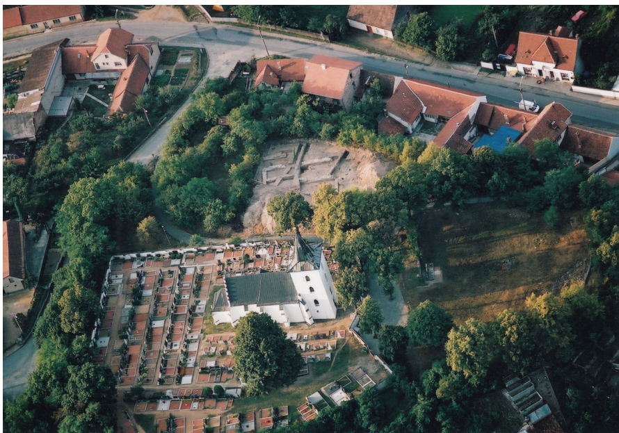
Letecký pohled na ostrožnu s kostelem, pozůstatky hradu a na výzkum na předhradí.