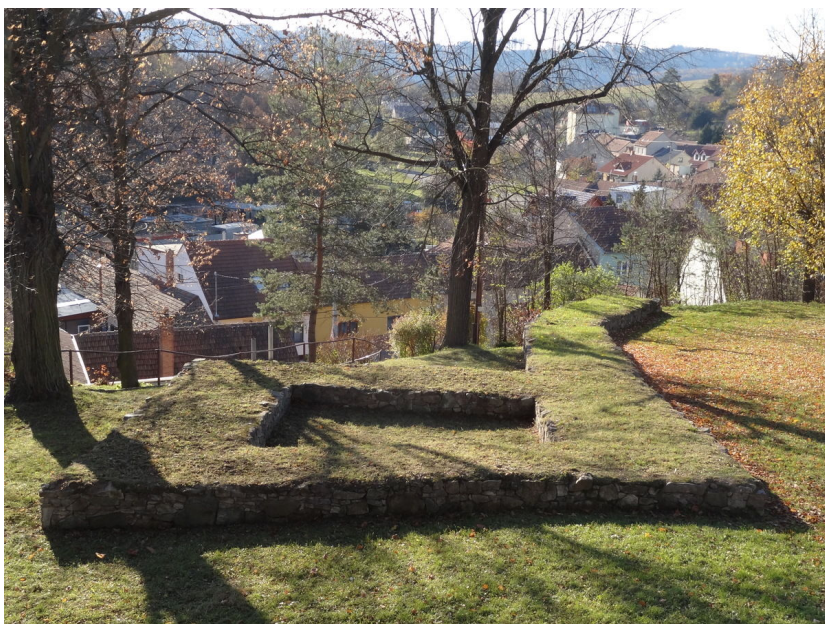
Prezentované hradební zdivo s věží.