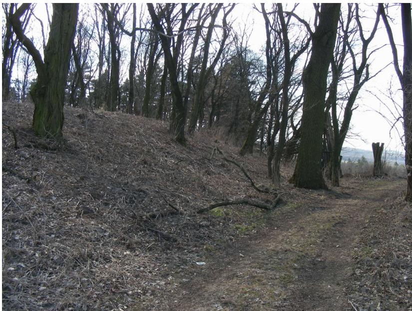
Pohled na val hradiště.