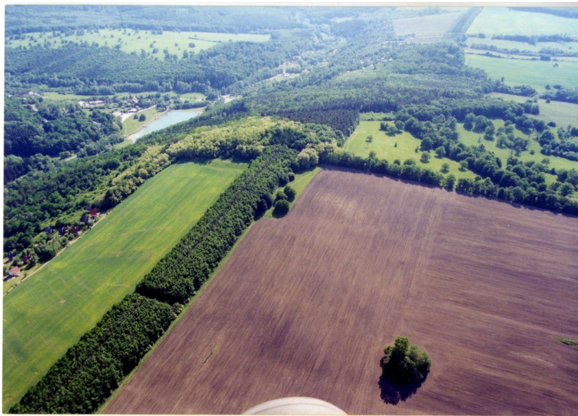
Letecký pohled na lokalitu.