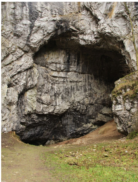
Detail upraveného vchodu do jeskyně.