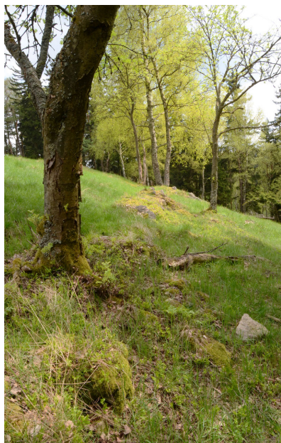
Mezní pás plužiny.