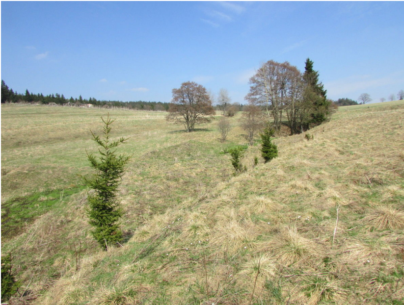
Ústí štoly sv. Barbory.