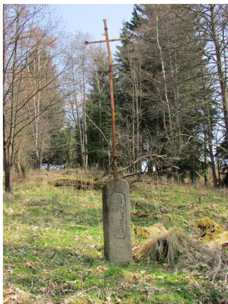
Kříž u jednoho ze zaniklých mlýnů.