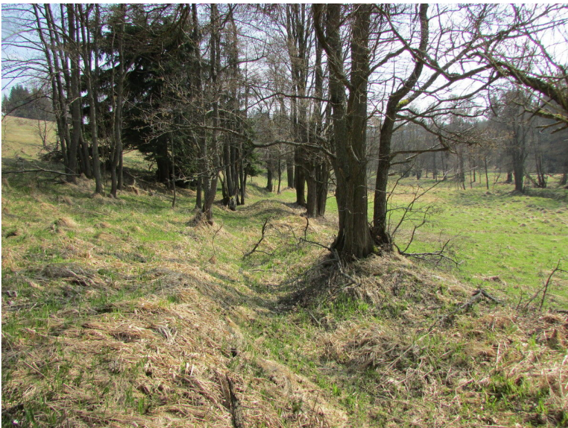
Náhon zaniklého mlýna.