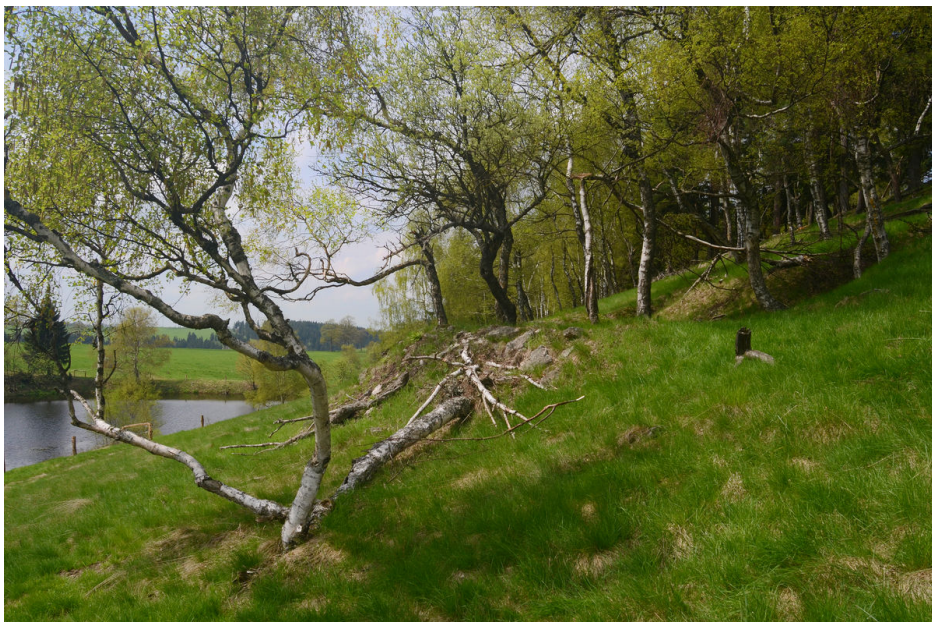
Ústí důlní chodby.