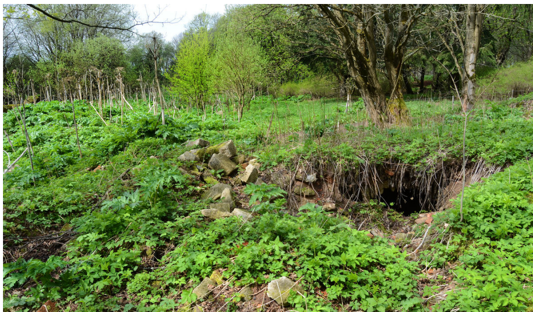
Pozůstatky městského domu (Lauterbach).