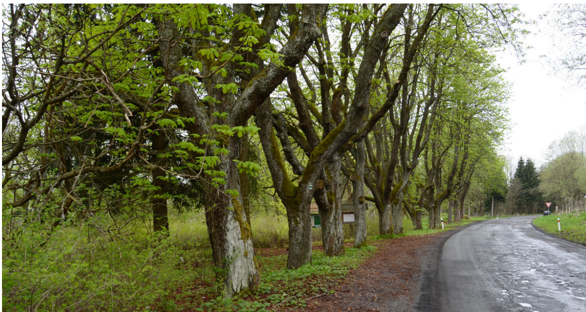
Alej v severní části bývalého náměstí (Lauterbach).