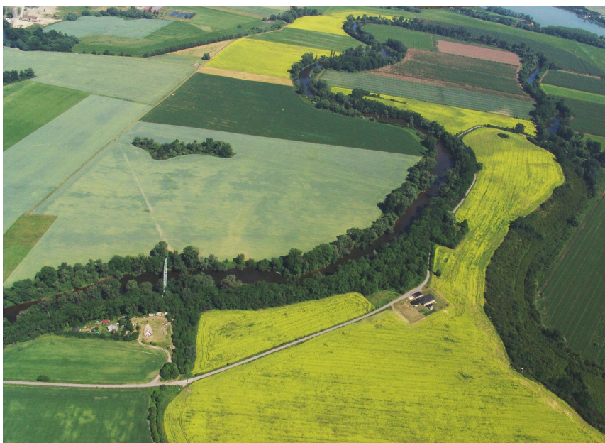
Letecký pohled na skanzen a na meandry řeky Ohře.