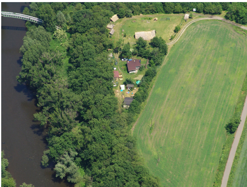
Letecký pohled na skanzen.