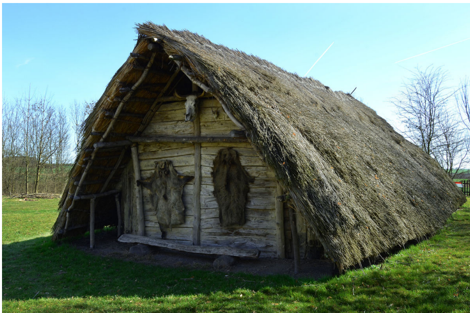
Zadní stěna neolitického dlouhého domu obložená zvířecí kůží.