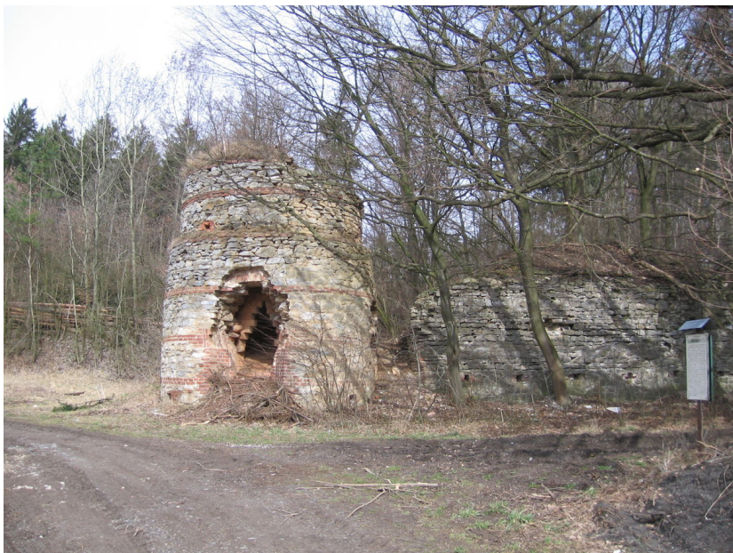
Šachtová vápenka z roku 1931 v Kovářově trati Rachava, současný stav, pohled od jihu.