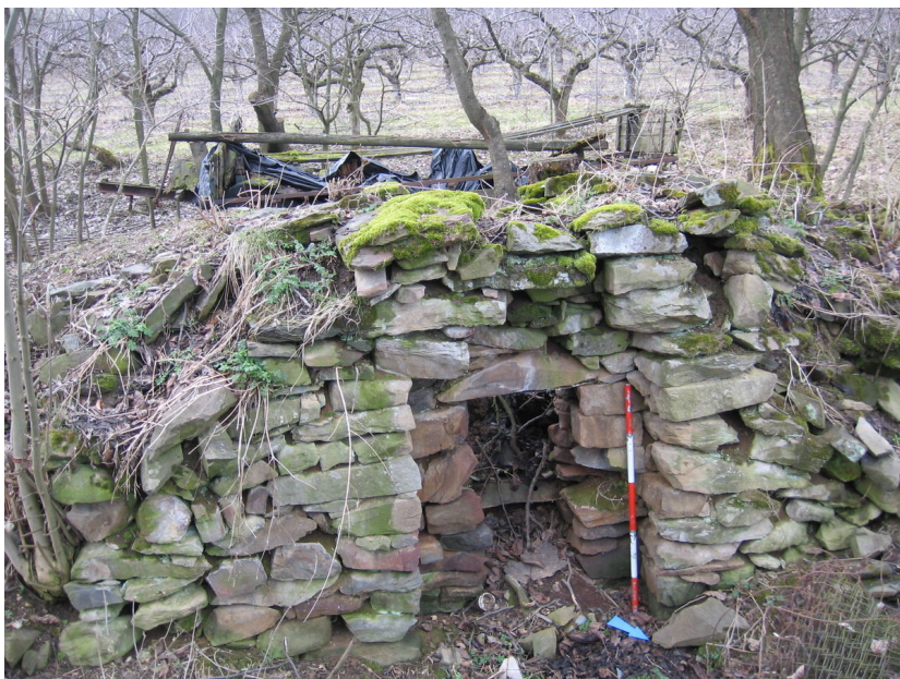
Navrátilova pec v Blažově, za humny statku čp. 17, pohled od severovýchodu.