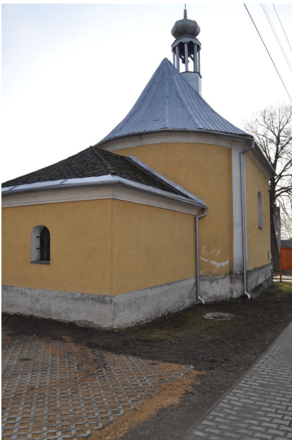
Břevenec, kaple sv. Antonína.