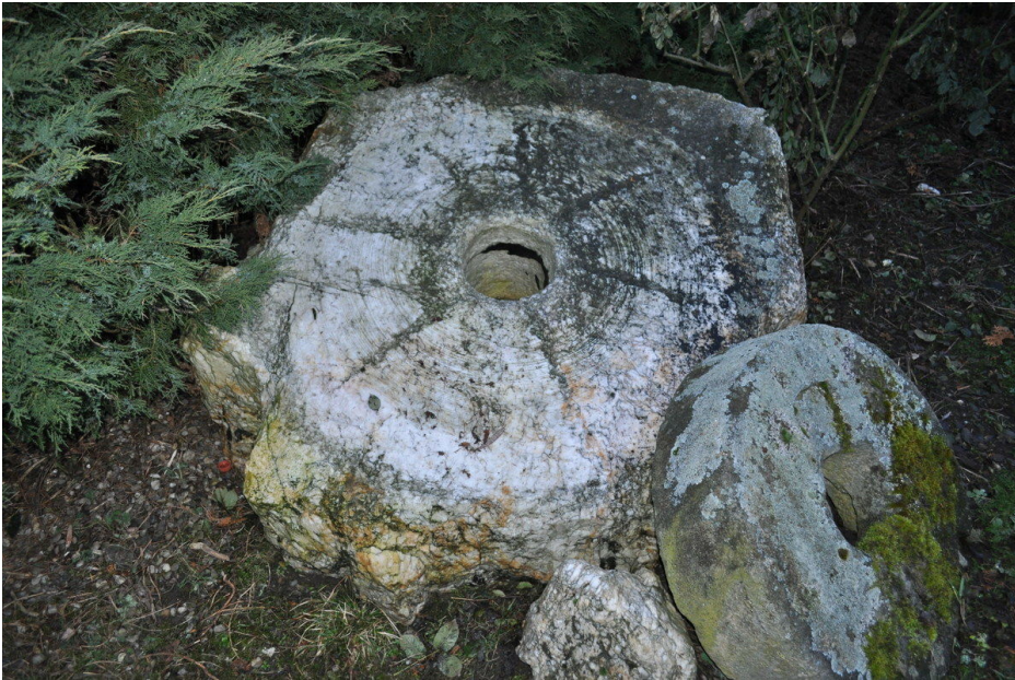
Dolní Dlouhá Loučka, středověký mlecí kámen z mlýna na rudu.