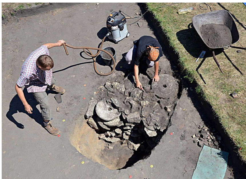
Archeologický výzkum v prostoru severovýchodního předhradí v r. 2013.