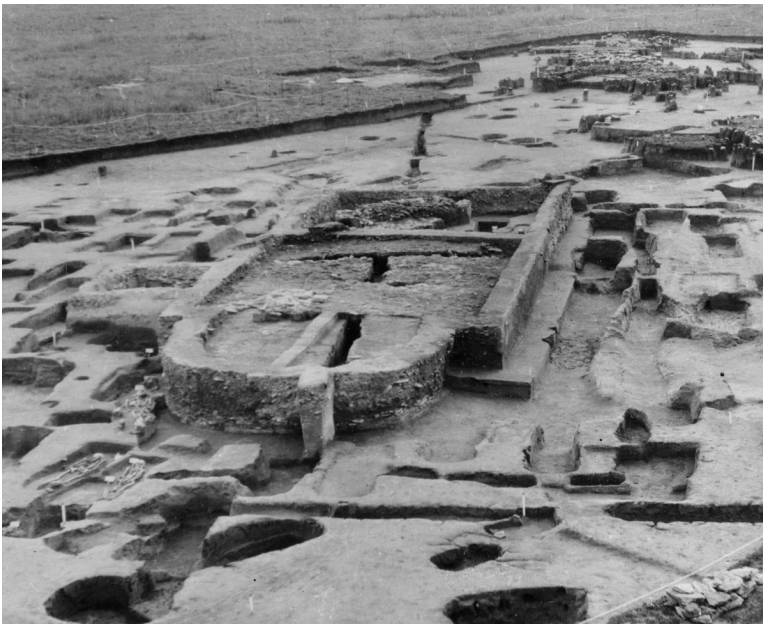
Archeologický výzkum v r. 1964. Velmožský dvorec s kostelem.