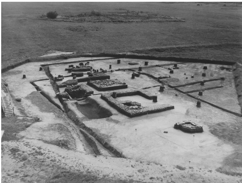
Archeologický výzkum v r. 1967. Pozůstatky kamenných podezdívek.

Foto M. Havelka, 1967. Archiv ARÚB, M-FT-101505500.