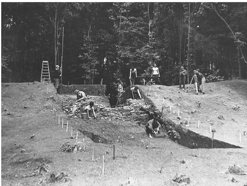
Archeologický výzkum pozůstatků opevnění v r. 1967.