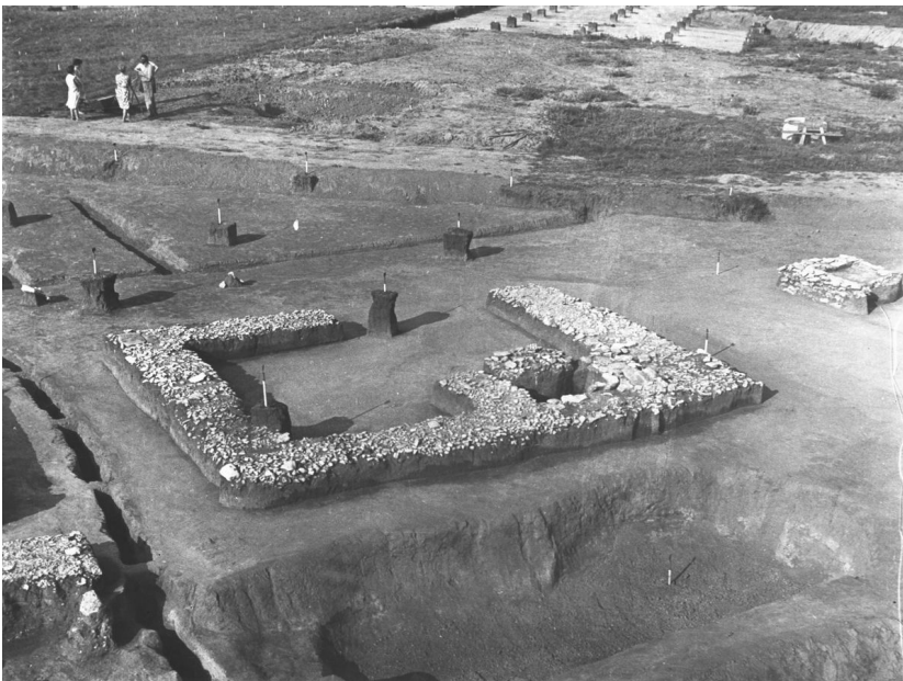
Archeologický výzkum v r. 1967. Pozůstatky z kamenných podezdívek domů.