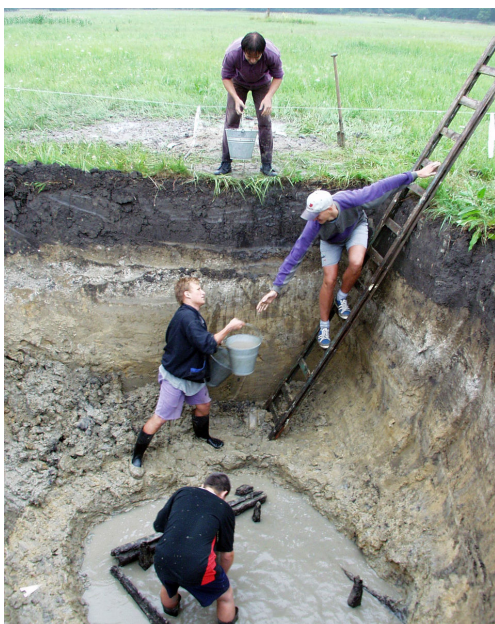
Archeologický výzkum v trati „Lesní hrůd“, který probíhal v l. 1999–2003.