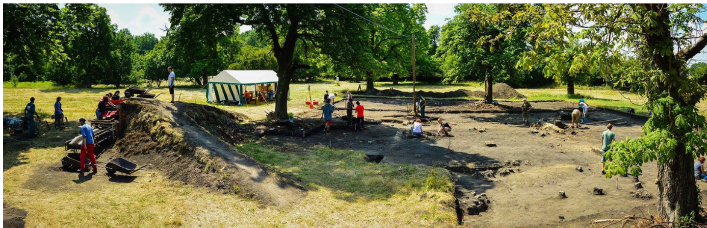
Archeologický výzkum v prostoru severovýchodního předhradí v r. 2018.