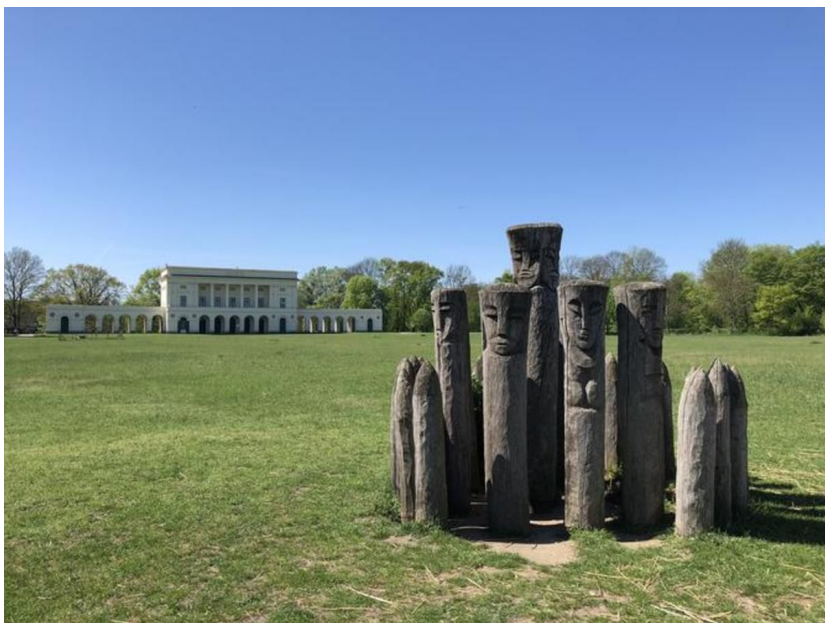
Rekonstrukce pohanského kultišťe.

Foto M. Havelka, 1967. Archiv ARÚB, M-FT-101505500.