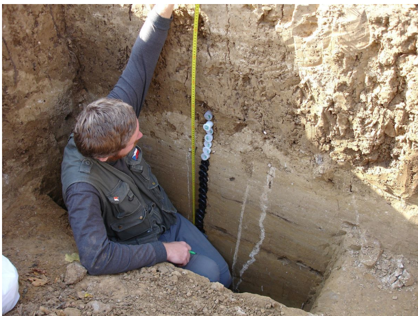
Pohled na profil sondy během odběru sedimentárních vzorků na lokalitě Boršice-Chrástka.