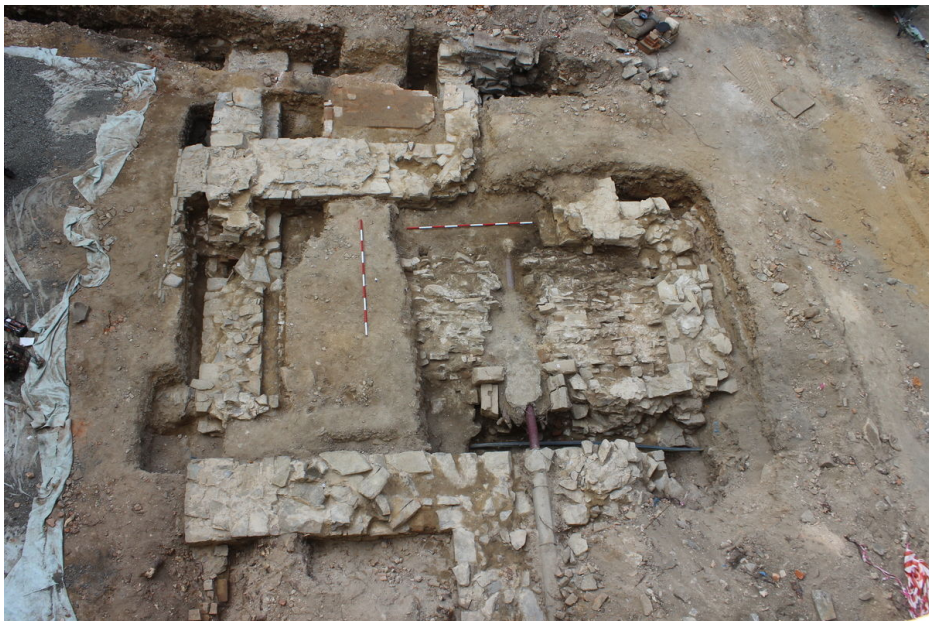
Pozůstatky hradní brány s druhotně vloženým klenutým suterénem.