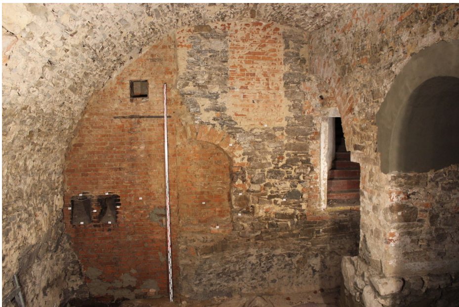
Valenou klenbou zaklenutý suterén nejstaršího jádra hradu s dodatečně vloženou arkádou.