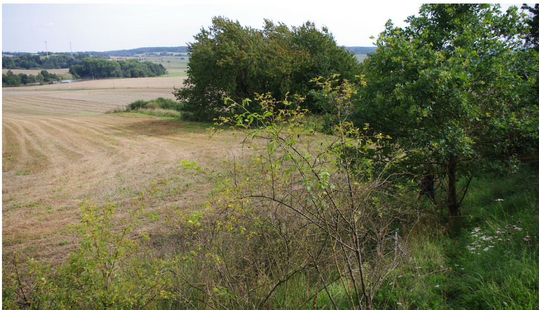
Vnitřní prostor čtyřúhelníkových valů.