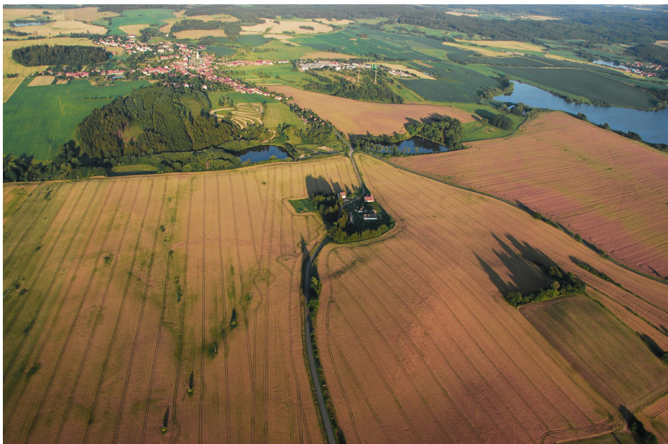
Letecký snímek – valy vpravo dole.