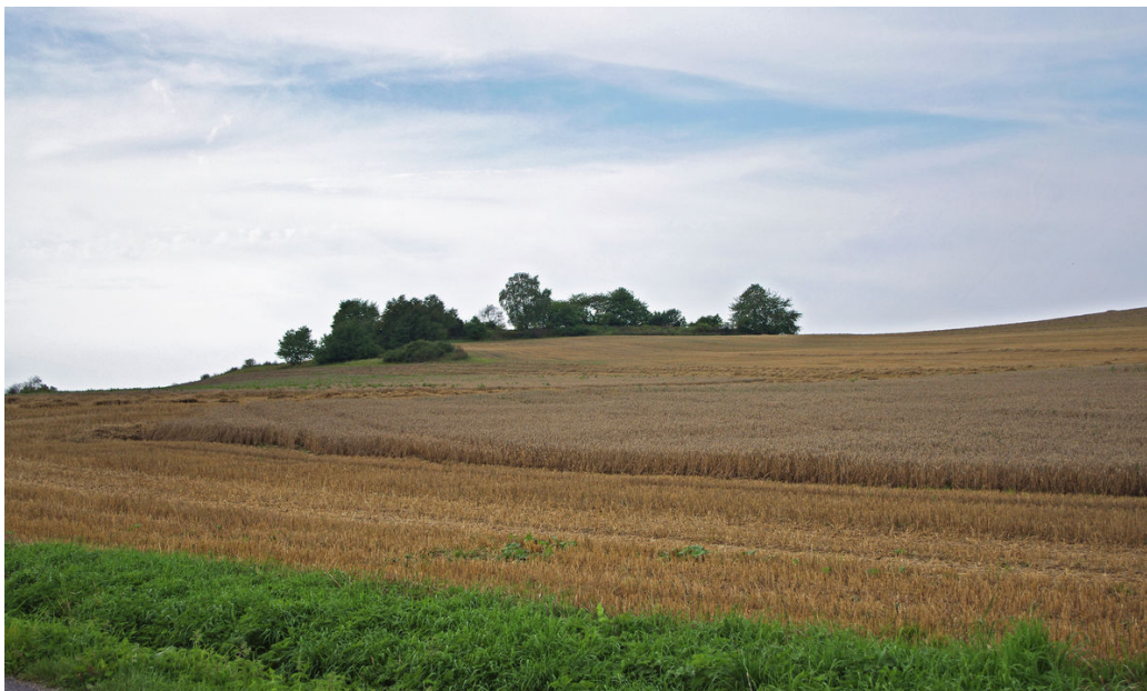
Pohled od jihovýchodu v pozdním létě.