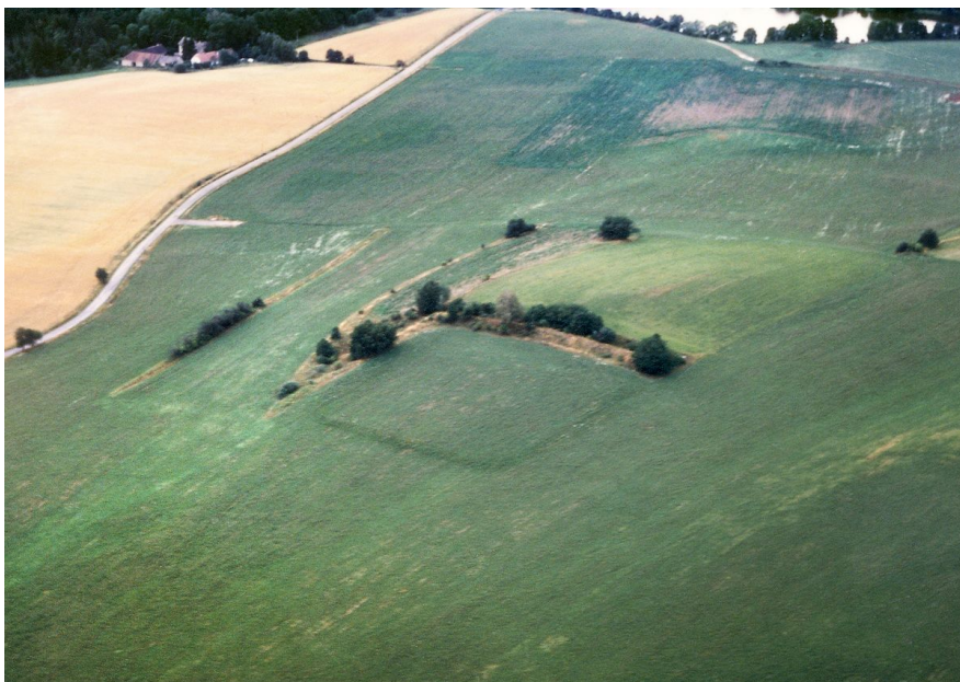
Letecký snímek s tzv. porostovými příznaky.