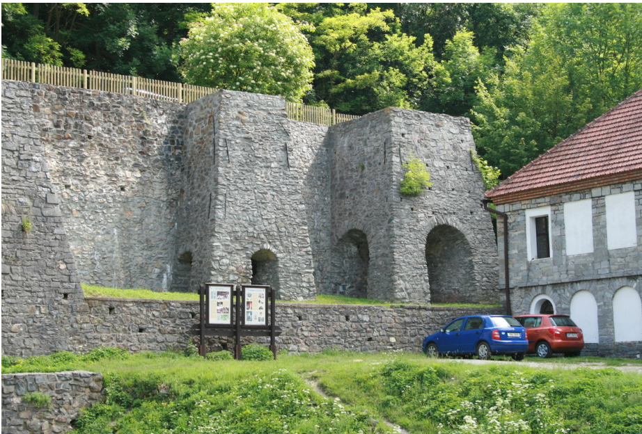
Pohled na zavážecí rampu, dvojici vápenných pecí a administrativní budovu. Foto K. Sklenář, 2009.