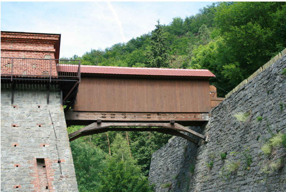
Vysoká pec Františka, rampa k peci.